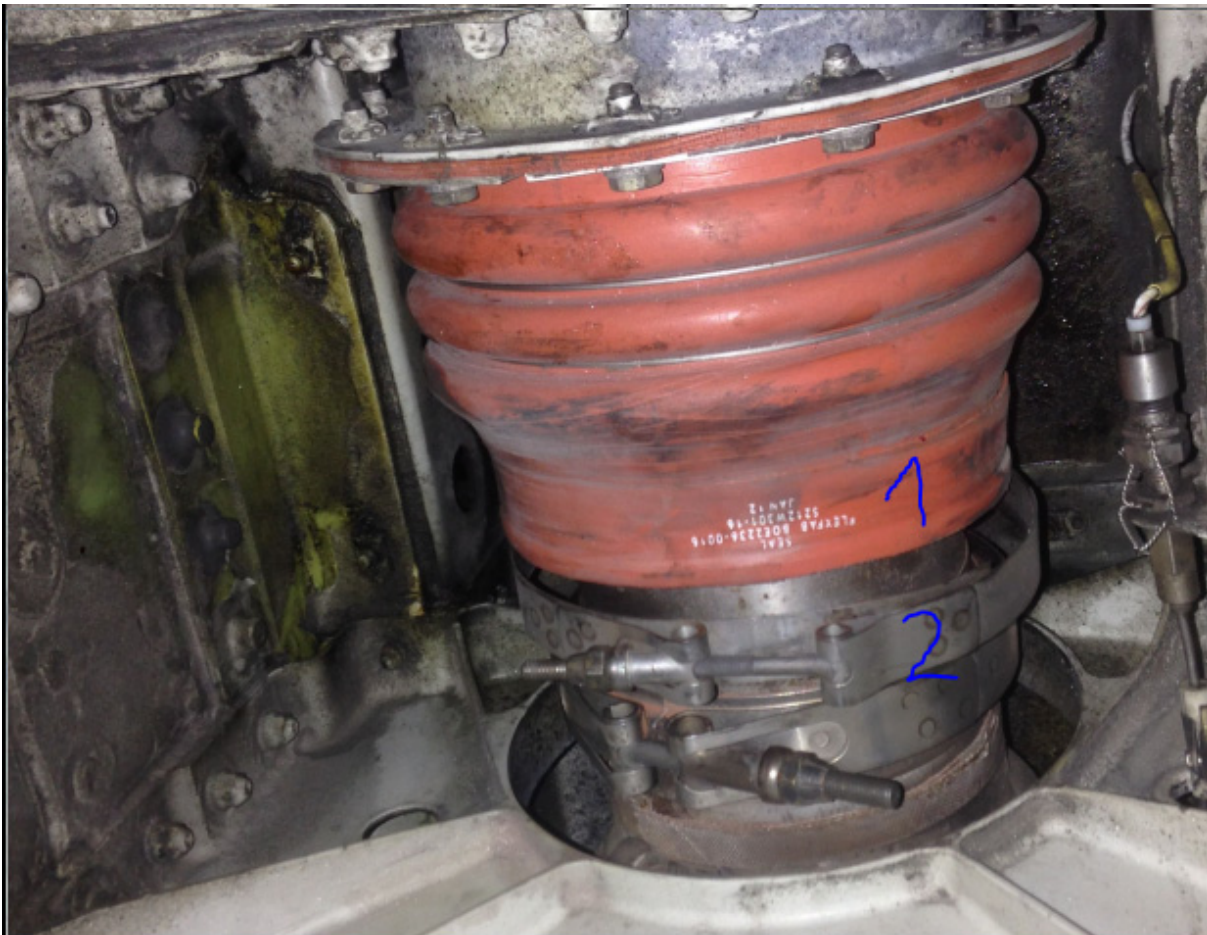
Bulk Seal mit gelöster Schelle (Loose Clamp)

Die nachstehende Abbildung zeigt die gelöste Schelle (Loose Clamp) in Position 2, die sich über dem Bulk Seal in Position 1 hätte befinden sollen.