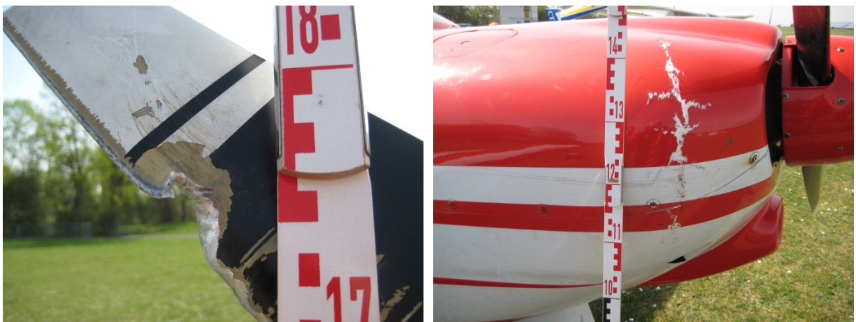
Beschädigungen am Propellerblatt und der Motorhaube

Das Flugzeug wies leichte Beschädigungen an einem Propellerblatt, an der rechten Seite der Motorhaube, am rechten Tragflügel im Bereich der Nasenkante sowie am Randbogen auf.