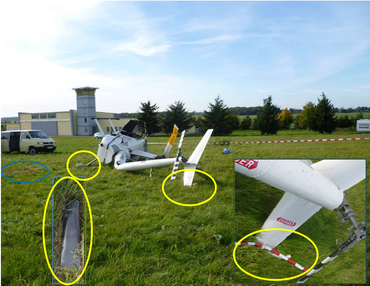
Hubschrauber mit abgebrochenem rechtem Kufenende und hoch gebogenem Sporn

sporn des Hubschraubers war aus seiner ursprünglichen Stellung nach oben gebogen. Der Heckrotor war nicht beschädigt. An der Unfallstelle lief Kraftstoff aus. Eine Restmenge von ca. 25 Litern Kraftstoff wurde abgelassen.