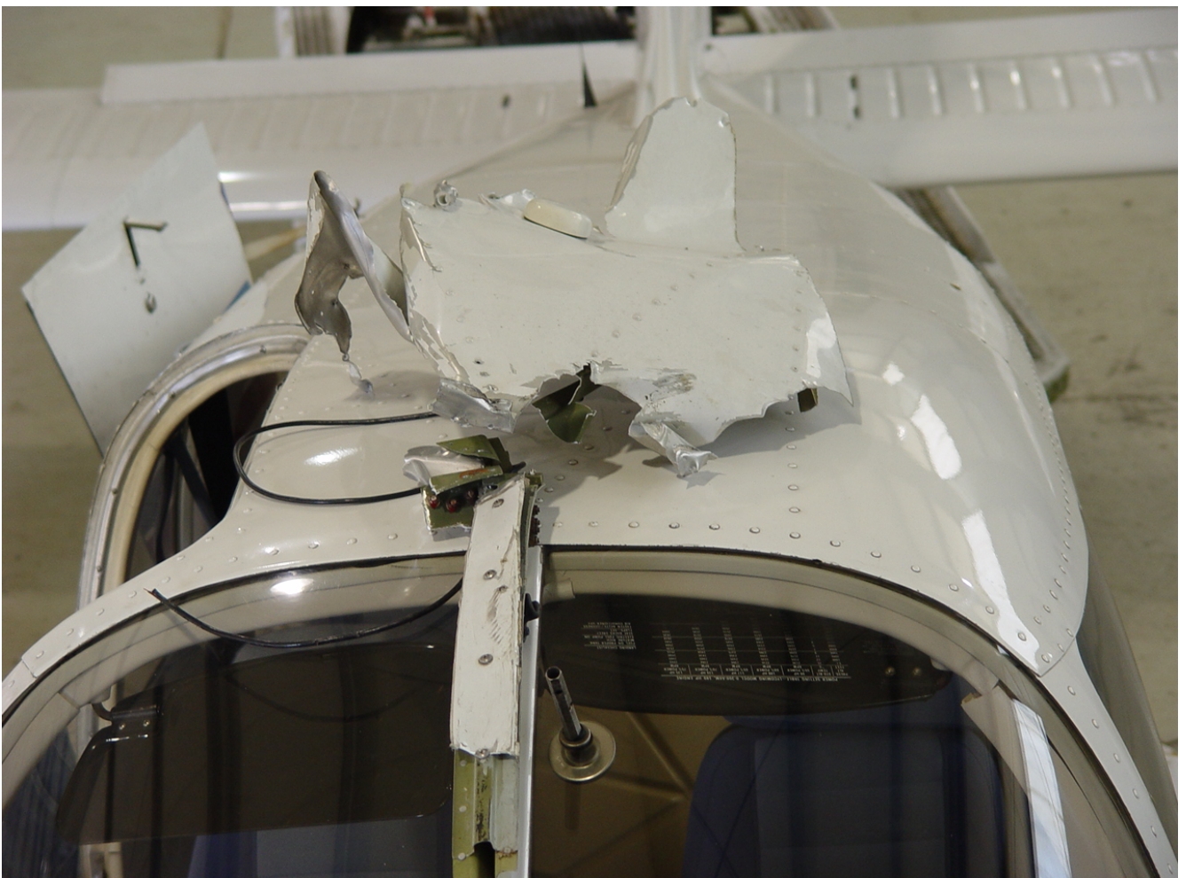
Das aufgefundene zerstörte Cockpitdach von Flugzeug 2, ausgelegt auf dem intakten Cockpitdach von Flugzeug 1

In einem Gebiet, das sich 700 Meter nördlich des Wracks von Flugzeug 2 befand und eine Ausdehnung von 1 000 Metern in nördliche und etwa 600 Meter in westliche Richtung hatte, wurden Trümmer von beiden Flugzeugen gefunden. In diesem Gebiet wurden das Bugrad und das rechte Hauptfahrwerk von Flugzeug 1 gefunden. Von Flugzeug 2 befand sich in diesem Gebiet ein Stück des Cockpitdaches, das hinter der GPS-Antenne abgerissen war. An dem Cockpitdach war ein Stück der Strebe der Frontscheibe des Flugzeugs angebracht. Diese Strebe war in der Mitte abgerissen, die andere Hälfte war an der Motorabdeckung am Wrack befestigt. Des Weiteren fanden sich Trümmerteile, die dem Seitenleitwerk von Flugzeug 2 zugeordnet werden konnten. Über das ganze Gelände verstreut waren zahlreiche kleinere Verkleidungsteile beider Flugzeuge und Bruchstücke der Flugzeugverglasung von Flugzeug 2.