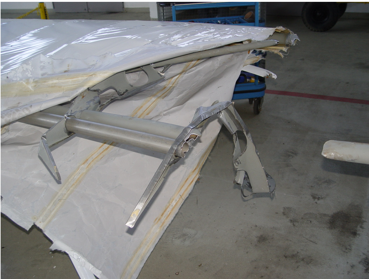
Anlage 2: In der Bildmitte ist der abgeknickte und gebrochene hintere Holm und das dahinter liegende gebrochene Querrudersteuerrohr zu sehen. Im Bereich der Bruchstellen befindet sich die deformierte Rippe 5. Am oberen Bildrand ist der gebrochene vordere Holm zu sehen.