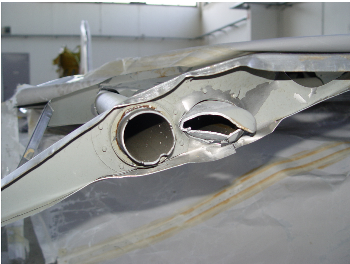
Anlage 3: Dieses Detailbild zeigt rechts den hinteren Holm und links das Querruderansteuerrohr; umschlossen von Rippe 5.