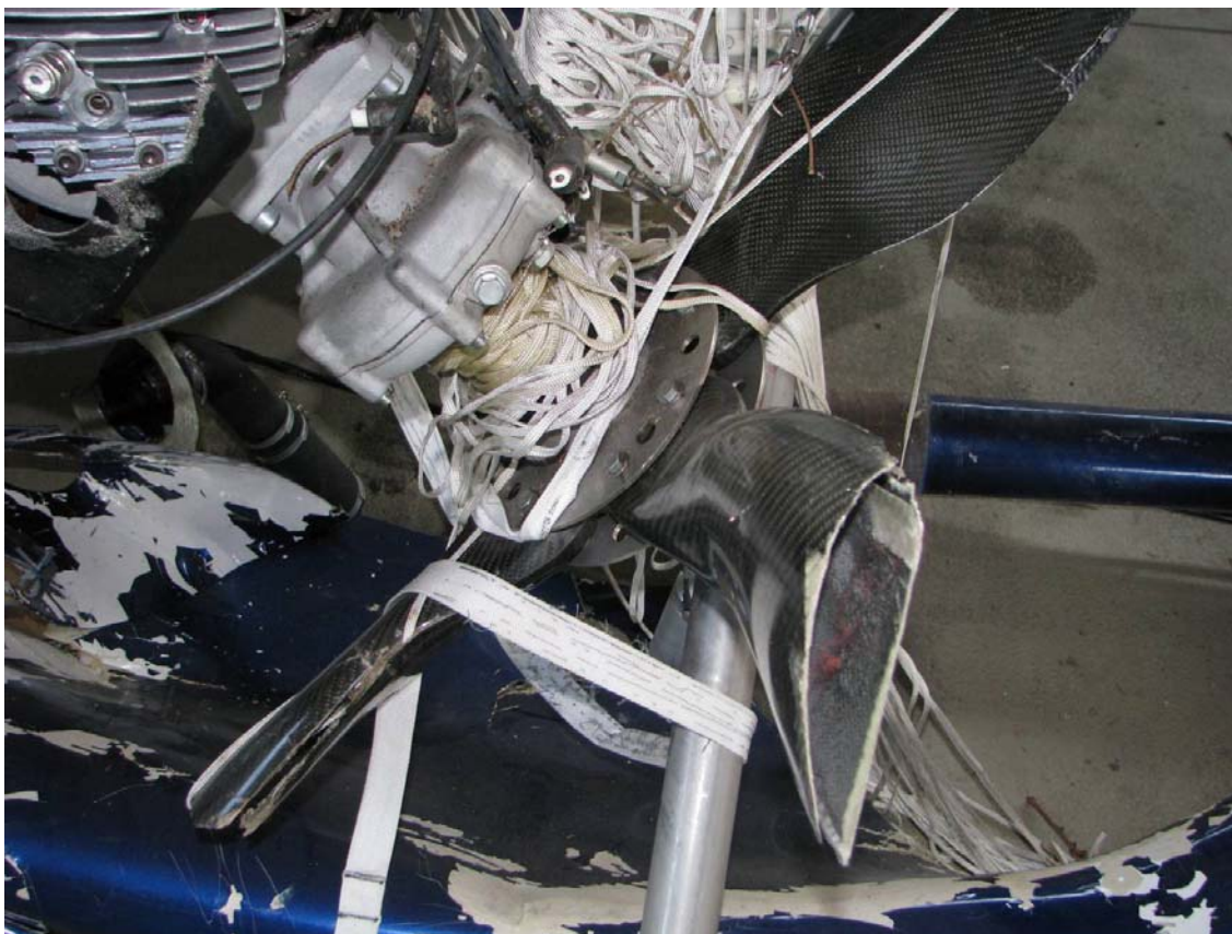
Anlage 4: Beschädigter Propeller mit von Fallschirmleinen umwickelter Propellernabe.