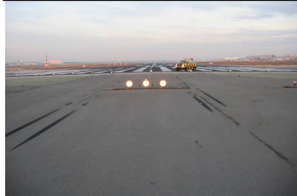
Aufsetzspuren sowie zwei fehlende Lampen rechts und links