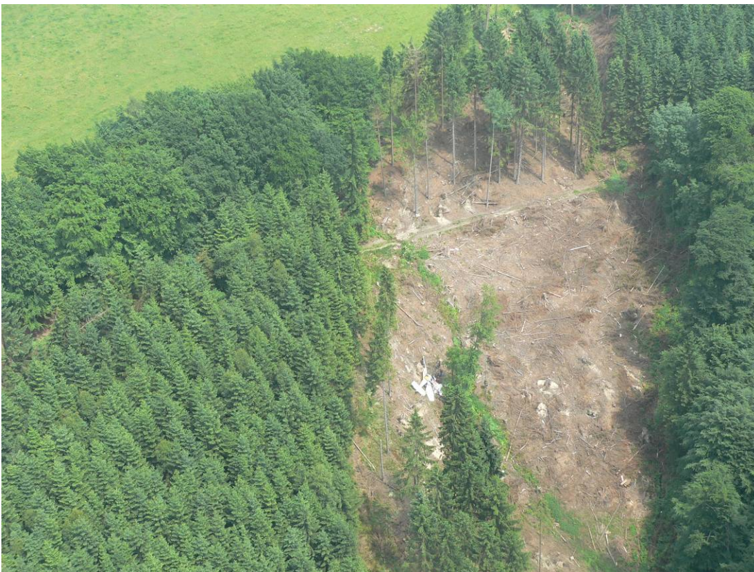
Unfallstelle aus der Luft