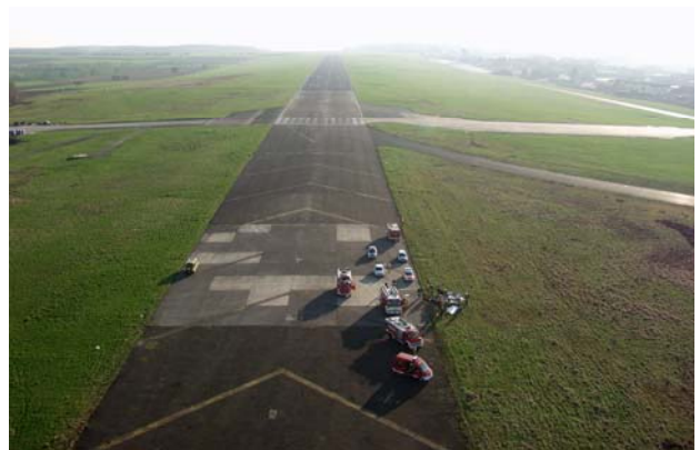
Abbildung 3: Flugplatz Bitburg mit Unfallstelle

Durch die Bodenberührung des Propellers scherten zwei Propellerblätter dicht am Spinner ab. Das Flugzeug blieb in Normallage in Richtung 150° liegen. Der Rumpf wurde vom Cockpit bis zum Heck massiv verformt. Die Wrackteile lagen dicht beisammen.