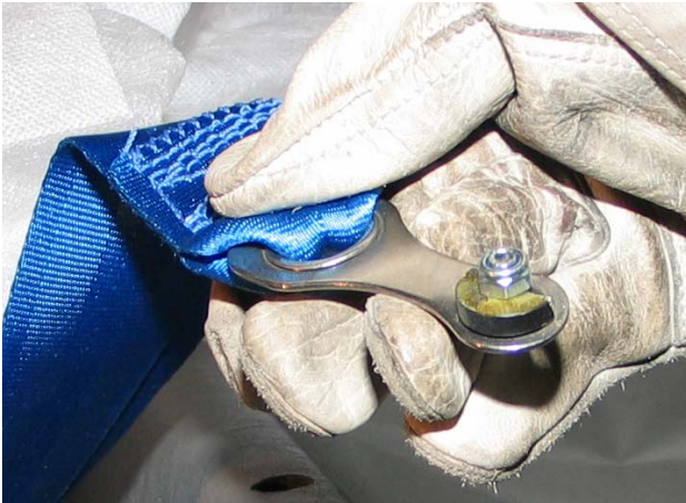
Abbildung 6: Abgerissene Beckengurtbefestigung

Es konnte festgestellt werden, dass alle Steuerstangen zu den Querrudern und zum Höhenruder angeschlossen waren.