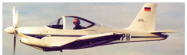
Abbildung 1: HB 207 V RG „Alfa“

Das Experimental-Flugzeug HB 207 V RG „Alfa“ war ein zweisitziger Tiefdecker mit einziehbarem Fahrwerk. Angetrieben wurde das Flugzeug von einem 4-Zylinder VW-Boxermotor mit zwei Doppelvergasern in Verbindung mit einem 3-Blatt Verstell-Propeller.