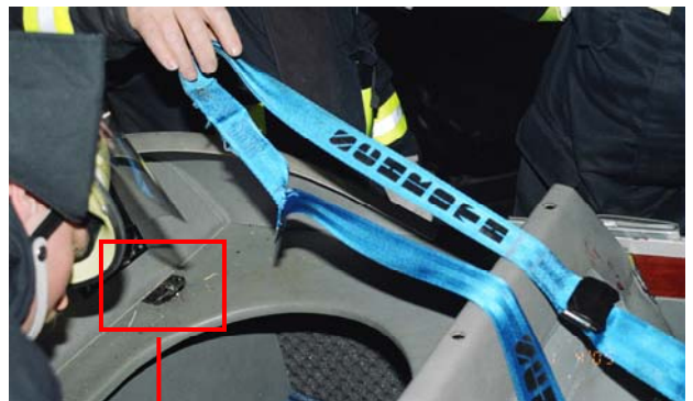
Abbildung 4: Gerissene Schultergurtbefestigungen

Der Pilot war mit einem Schroth 4-Punkt-Gurt angeschnallt. Die beiden Schultergurte wurden, hinter dem Sitz zusammengeführt und mittels eines einzelnen Verbindungsgurtes an der Struktur hinter dem Sitz befestigt. Die Lasche der Schultergurtbefestigung riss beim Aufprall durch. Infolgedessen riss auch die linke Beckengurtbefestigung.