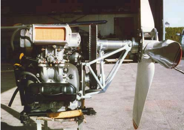
Abbildung 2: VW-Boxermotor der HB 207

Das Flugzeug wurde als Bausatz ausgeliefert und war vorwiegend aus Aluminium hergestellt. Es hatte eine Spannweite von 9,03 m und ein maximales Abfluggewicht von 750 kg.