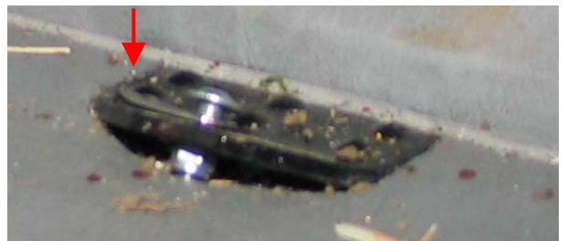
Abbildung 5: Schultergurtbefestigung