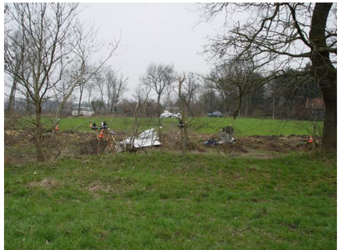
Blick in Flugrichtung

Die von der Deutschen Flugsicherungs GmbH (DFS) aufgezeichneten Radardaten zeigen eine Flugspur, die zwischen den Ortslagen Linswege und Grafenfeld hin und her führt. Nach einer Flugdauer von zehn Minuten berührte das Flugzeug in 3,3 km Entfernung vom Flugplatz in Verlängerung der Startbahn 07 Bäume und stürzte auf einen angrenzenden Acker. Dabei wurde das Flugzeug zerstört und der Pilot getötet.