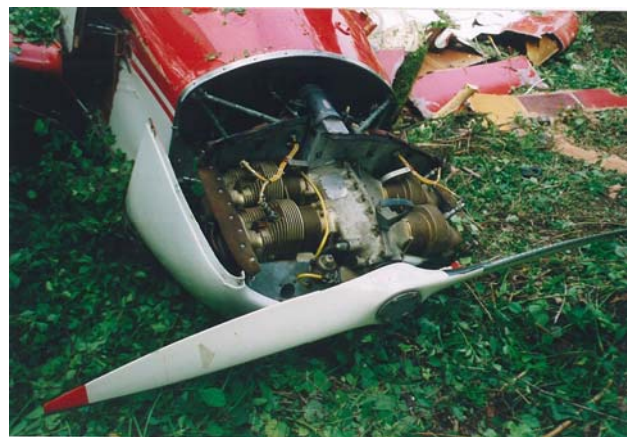
Abbildung 3: Motor und unbeschädigter Propeller

Die Untersuchung der Kraftstoffverbindungen ergab, dass die Kraftstoffschläuche frei durchlässig und mit Kraftstoff gefüllt waren. Es zeigte sich jedoch, dass am Bugtank eine Filtereinrichtung mit feinkörnigem Material zugesetzt war. Die Untersuchung des pulverartigen Materials ergab, dass es sich dabei um Anhaftungen mit den Elementen Blei und Zinn handelte. Mineralische Bestandteile, wie Sand oder Zucker konnten nicht nachgewiesen werden.