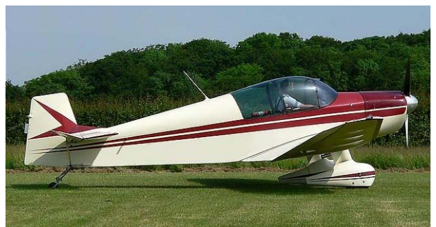
Abbildung 1: Jodel DR 1050 Ambassadeur

Angetrieben wurde das Flugzeug von einem Continental Kolben-Boxermotor O-200 A, der mit AVGAS 100LL betrieben wurde. Es hatte eine Gesamtbetriebszeit von 2316 Stunden. Seit der letzten Grund berholung waren das Flugwerk 1096 Stunden und der Motor 1300 Stunden in Betrieb.