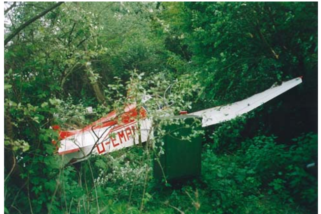
Abbildung 2: Verunglückte Jodel an der Unfallstelle

Die weitere Untersuchung ergab keine erkennbaren Mängel an Vergaser, Auspuff, Zündkerzen und Zündmagneten. Aus dem Bugtank konnten nach dem Unfall 20 l und aus dem Hecktank 30 l Kraftstoff abgepumpt werden.