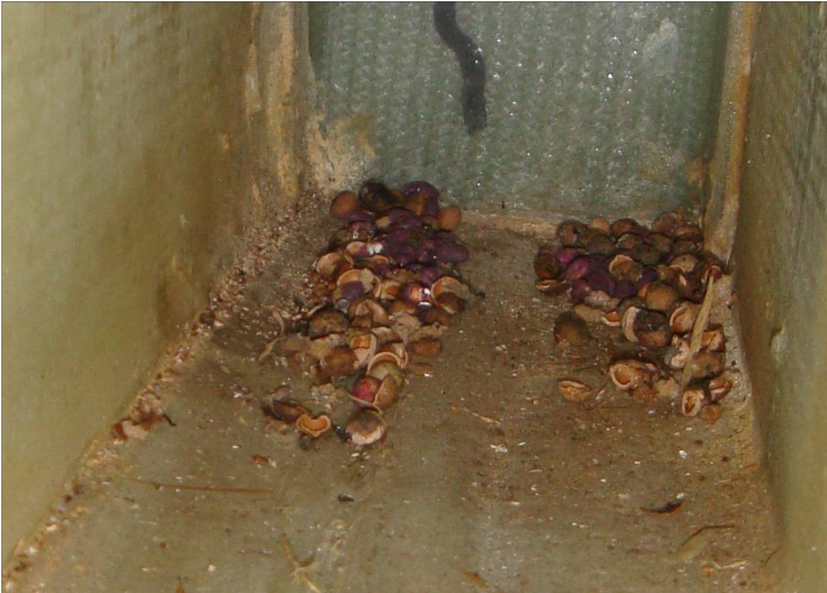
Futterreste eines Tieres im Inneren des Motorseglers